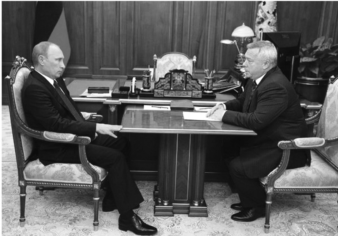
● Президент В.В. Путин одобрил работу правительства области

Бизнес области, по мнению губернатора, отнесся с понима-